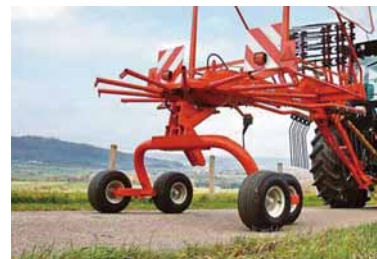
※写真は海外仕様の為実際とは異なる場合があります。

ティンアームは簡単に取外し可能です。本機の前側のラックに収納すれば、トラクターで持ち上げる際の油圧への負担が軽減できます。