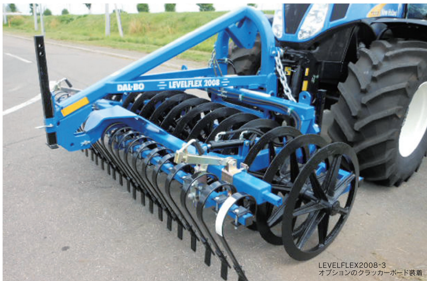
LEVELFLEX2008-3 オプションのクラッカーボード装着